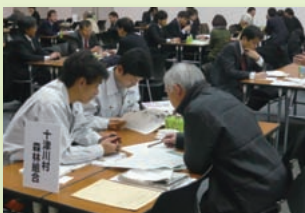
近年のふるさとと森林相談会の面談者数(四大都市の例)