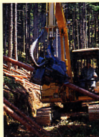
わが国の林業現場に進出した林業機械の開発と技術者の育成が求められている

効率的な作業を可能にし、かつ若者が嫌う「キケン、キタナイ、キツイ」いわゆる3Kといわれる労働環境を改善するために、高性能林業機械化を進めている林業現場も増えてきている。