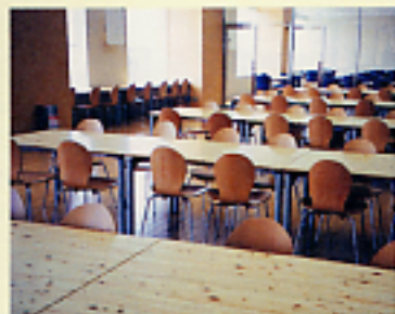
地元の間伐材を利用した富士通テクノロジーセンターの食堂のテーブル

コクヨ株式会社では、間伐材を活用したデスク等の家具製品を提案し、森林保全の一環として取り組んでいる。さらに、地域の間伐材は地域で利用する「地域循環型資源活用」を提唱し、地域内加工を目指し地域林業への貢献を図りながら大量生産ではなく受注生産で対応している。