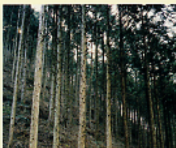
間伐が遅れると、費分に富んだ大切な表土層が流れ出して、保水力はおろか生育環境も著しく損なわれる