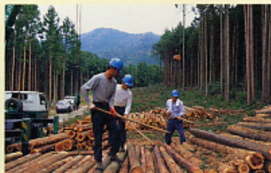
都市部から林業を志す若者が増えている

緑の雇用事業とは、荒廃が進む森林や清流を自治体の取り組みとして新たに働き手を雇用し、森林を整備して水土保全や地球温暖化防止を図るとともに、同時に失業対策にも役立てようというものである。年々失業率が悪化をたどる状況を受け、地方の雇用安全網（セーフティネット）として、平成13年9月に、木村良樹和歌山県知事と北川正恭三重県知事が共同提案した。