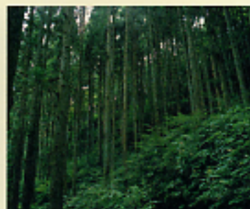
適切な間伐が豊かな下層植生を育み、生物多様性の森林づくりにもつながる