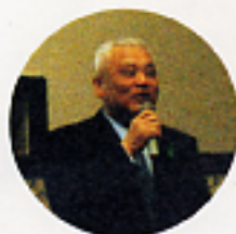
全国森林組合連合会 代表理事会長